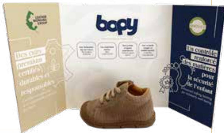
PLV 3 VOILETS / PRÉSENTATION 3 PANELS