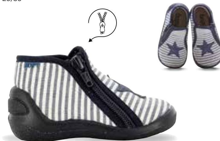
BLANC / BLEU RAYÉ

DESSUS TEXTILE - DOUBLÉ TEXTILE - PREMIÈRE CUIR TEXTILE UPPER - TEXTILE LINING - LEATHER INSOLE 20/30