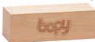
BLOC DE BOIS / BLOCK OF WOOD