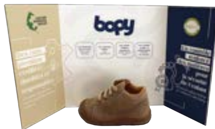
PLV 3 VOILETS / PRÉSENTATION 3 PANELS