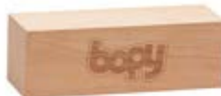
BLOC DE BOIS / BLOCK OF WOOD