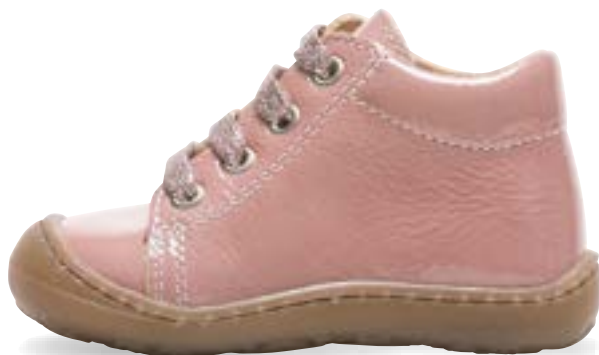
VIEUX ROSE VERNIS